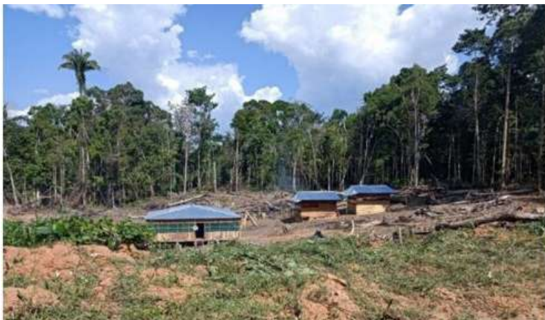
Figura 1. Asentamientos de colonos en el territorio de la CN Centro Arenal

vía ha potenciado el ingreso de traficantes de tierras que realizan actividades de desbosque hacia las afueras de la ciudad de Iquitos, y se han asentado en casas como se aprecia en la siguiente fotografía: