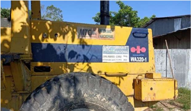
Figuras 3 y 4. Rastros de vehículos con identificaciones del MTC-Provías Nacional en la vía carrozable superpuesta a la CN Centro Arenal, reconocida por las comuneras como parte del Tramo II de la carretera Bellavista-Mazán-Salvador-El Estrecho