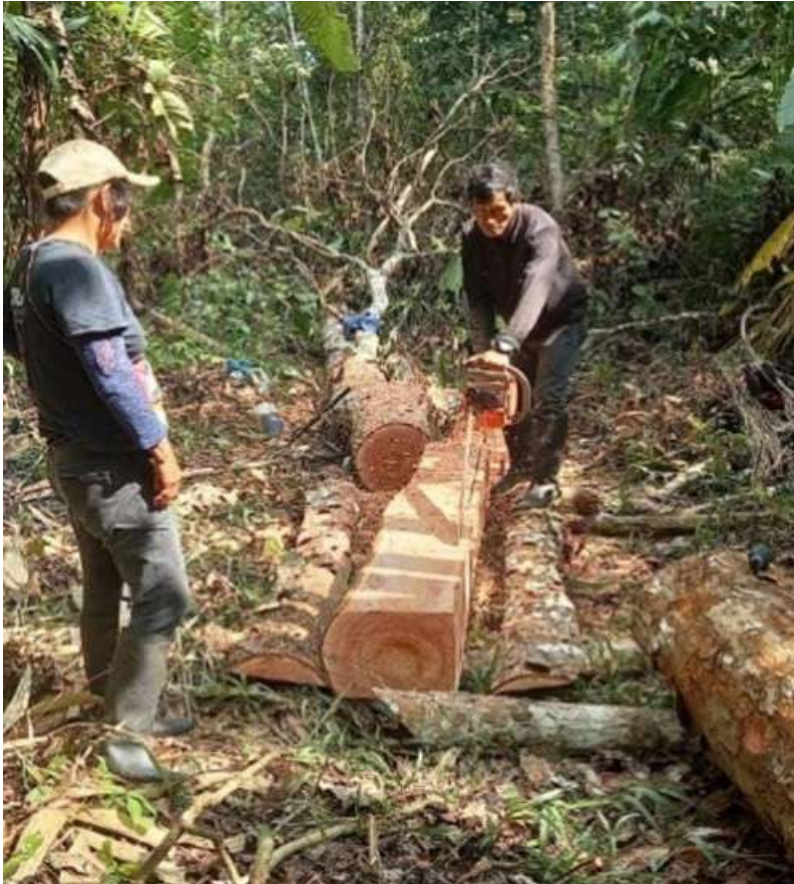
Figura 6. Madera talada ilegalmente

colonos para fotografiarlos y contribuir con la PNP para las sanciones correspondientes, sin embargo, esto tampoco ha funcionado.