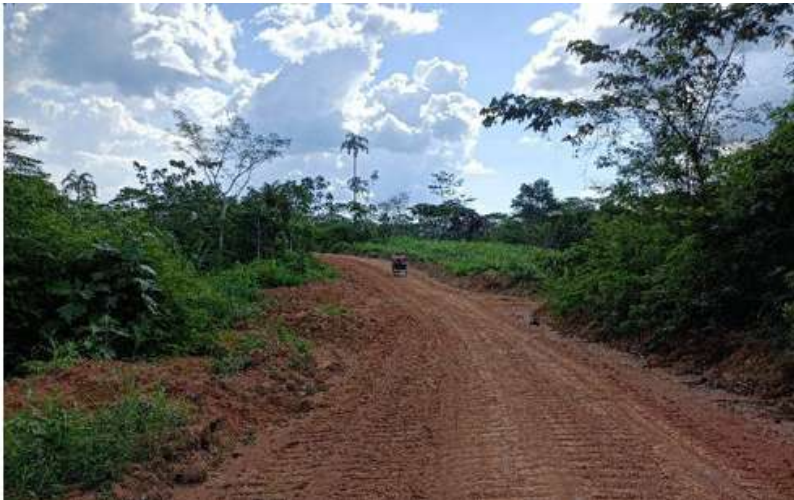
Figura 2. Vía carrozable superpuesta a la CN Centro Arenal, reconocida como parte del Tramo II de la carretera Bellavista-Mazán-Salvador-El Estrecho

Mientras la comunidad se encuentra en incertidumbre jurídica, por el otorgamiento de títulos de propiedad individual superpuestos a sus tierras comunales, y ante la creciente presencia de traficantes de tierra; las autoridades que impulsan la construcción de la carretera —el Ministerio de Transporte y Comunicaciones MTC, a través del Proyecto Especial de Infraestructura de Transporte Nacional Provías Nacional—, indican que el tramo II —que es el que se superpone a la comunidad— aún no se encuentra en ejecución. 16 Sin embargo, la realidad es distinta, pues no solo existen vías carrozables sino marcas asentadas de tractores con identificaciones del MTC: