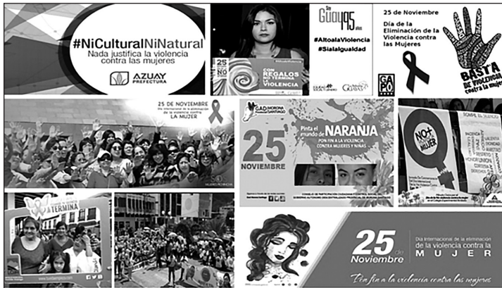
Ilustración 2. Campañas contra la violencia a la mujer