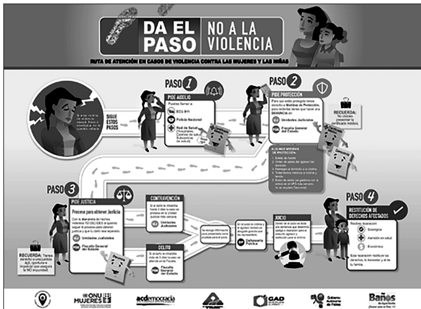
Ilustración 1. Ruta de Atención en Caso de Violencia Contra las Mujeres y las Niñas