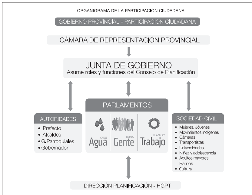
Gráfico 1. Organigrama de la Participación Ciudadana de Tungurahua

Fuente: Agenda Tungurahua 2018-2020 Elaboración: H. Gobierno Provincial de Tungurahua