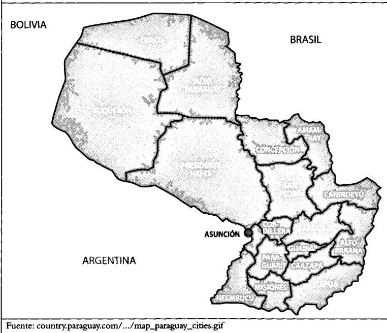
Gráfico 1. Mapa de Paraguay

La región oriental cuenta con los siguientes departamentos: