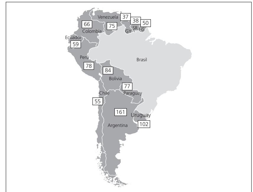
Mapa 2 - Mapa de Actos Binacionales de Brasil con los países de América del Sur