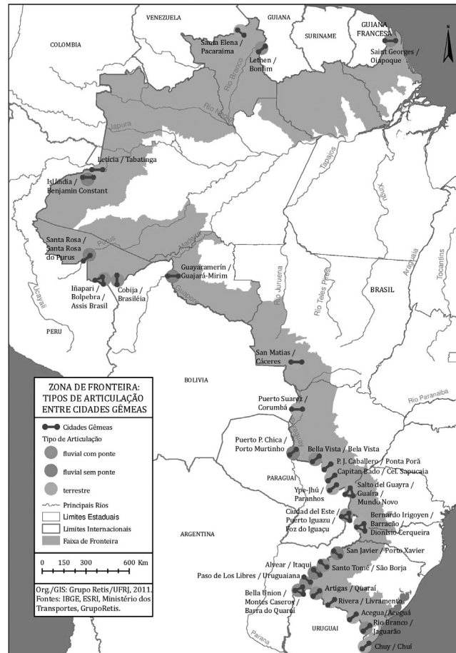
Mapa 1 - Faja de Frontera de Brasil y Ciudades Gemelas