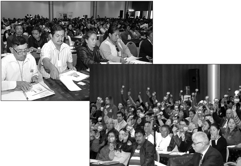
Foto 1. Asamblea provincial

Al principio, solo consideramos la estructuración mancomunada de los presupuestos pero el mismo proceso abrió la posibilidad de construir un sistema de gestión administrativa que actualmente propicia una más amplia participación ciudadana. Hoy contamos con un Parlamento Popular Provincial que se realiza una vez al año con dos objetivos centrales: conocer y evaluar lo actuado por el Gobierno intermedio y elaborar el Plan Operativo Anual (POA) del siguiente año a partir de los temas y acciones priorizadas que también forman parte del Plan de Desarrollo y Ordenamiento Territorial (PDOT). Debido a la demanda de ciertos sectores de la población y por la necesidad de tratar temas específicos de intereses grupales concretos, se crearon también las Asambleas Sectoriales (mujeres, juventud, comunidad LGBTI, pueblos y nacionalidades) y las Asambleas Temáticas (minería, defensa del agua, gestión vial, entre otras).