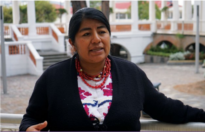
Pie de foto - pie de foto -