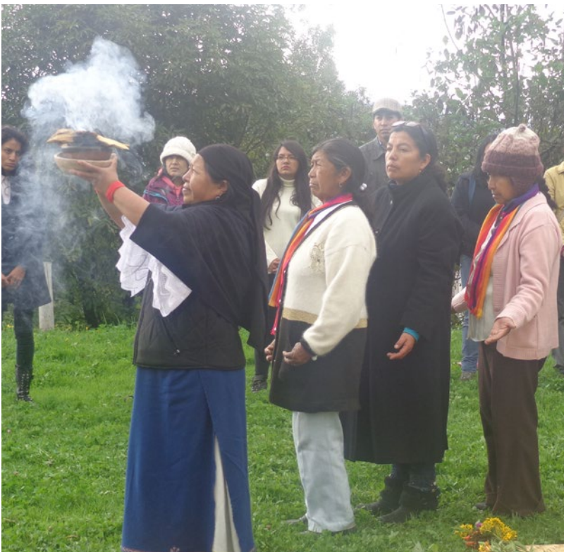
Pie de foto - pie de foto -

La Ley 103, contra la violencia hacia la mujer y la familia, aunque para su aplicación carece de un enfoque intercultural; ha servido durante años como mecanismo de protección de las mujeres diversas ecuatorianas, frente a situaciones de violencia intrafamiliar. Actualmente está en proceso de revisión el Código Integral Penal, y en este marco se propone la permanencia de la Ley 103, con algunas reformas que aseguren su aplicación en contextos de diversidad.