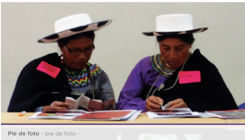
Pie de foto - pie de foto -