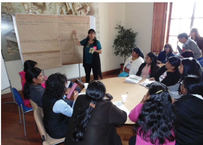
Pie de foto - pie de foto -

“No somos migrantes estamos en nuestro propio territorio, aceptaríamos que somos migrantes se estuviéramos en Nueva York. No aceptamos que nos digan migrantes, como de estos territorios”.