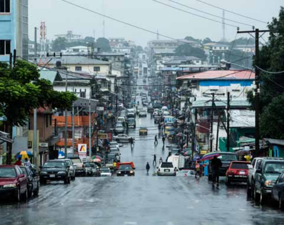
▲ Monrovia, Liberia, durante la cuarentena del ébola

pales, económicas y sociales de las ciudades para aceptar (y, donde sea necesario, integrar) a grandes olas de migrantes de diferentes contextos económicos y socioculturales. Esto no requiere simplemente servicios básicos (vivienda, salud, educación, empleo), sino también un enfoque más abarcador que incluya el abordaje de la inclusión y el riesgo de conflictos, igualdad, voz y participación, planificación fiscal y sistemas de financiación del desarrollo, desarrollo económico, coordinación nacional y regional y mecanismos de acción conjunta.