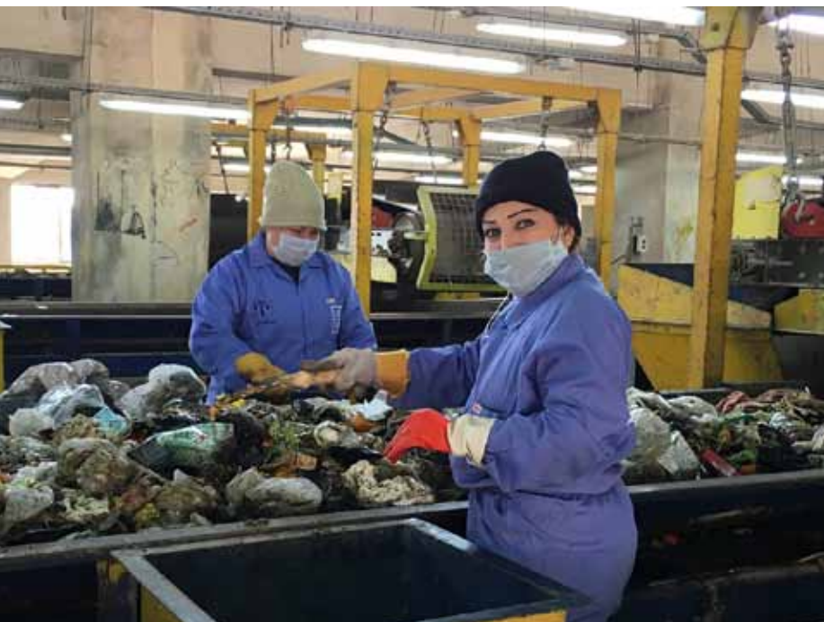
▲ El PNUD crea empleos para la eliminación y el desecho de residuos sólidos a fin de contribuir a mantener un medio ambiente limpio

prestadores de bienes y servicios, en particular, para los residentes de sectores pobres y la clase trabajadora. Además, ven a estos negocios informales como puntos de ingreso cruciales que les permiten a los pobres, los migrantes y otros grupos marginados ganarse la vida e integrarse a las ciudades. Es importante considerar hasta qué punto las ciudades dan lugar a la informalidad y la alientan cuando se fomenta un clima de iniciativa empresarial. La informalidad estimula un clima comercial que impulsa la creación de empleo y la innovación. Lograr el equilibrio entre el dinamismo y la diversidad de los negocios informales frente a la necesidad de estructura y eficiencia es una decisión delicada con la que deben lidiar muchas ciudades en crecimiento.