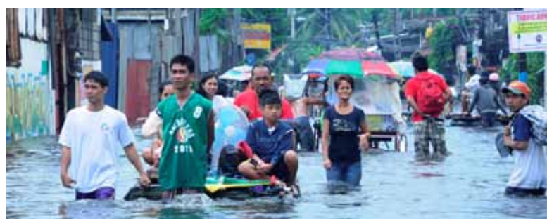
▲ Unos obañeros caminan por las calles inundadas de Obando, Bulacan, tras el paso del tifón Ondoy (Ketsana). El PNUD está trabajando para reducir la vulnerabilidad de los filipinos ante las amenazas naturales y aumentar su resiliencia