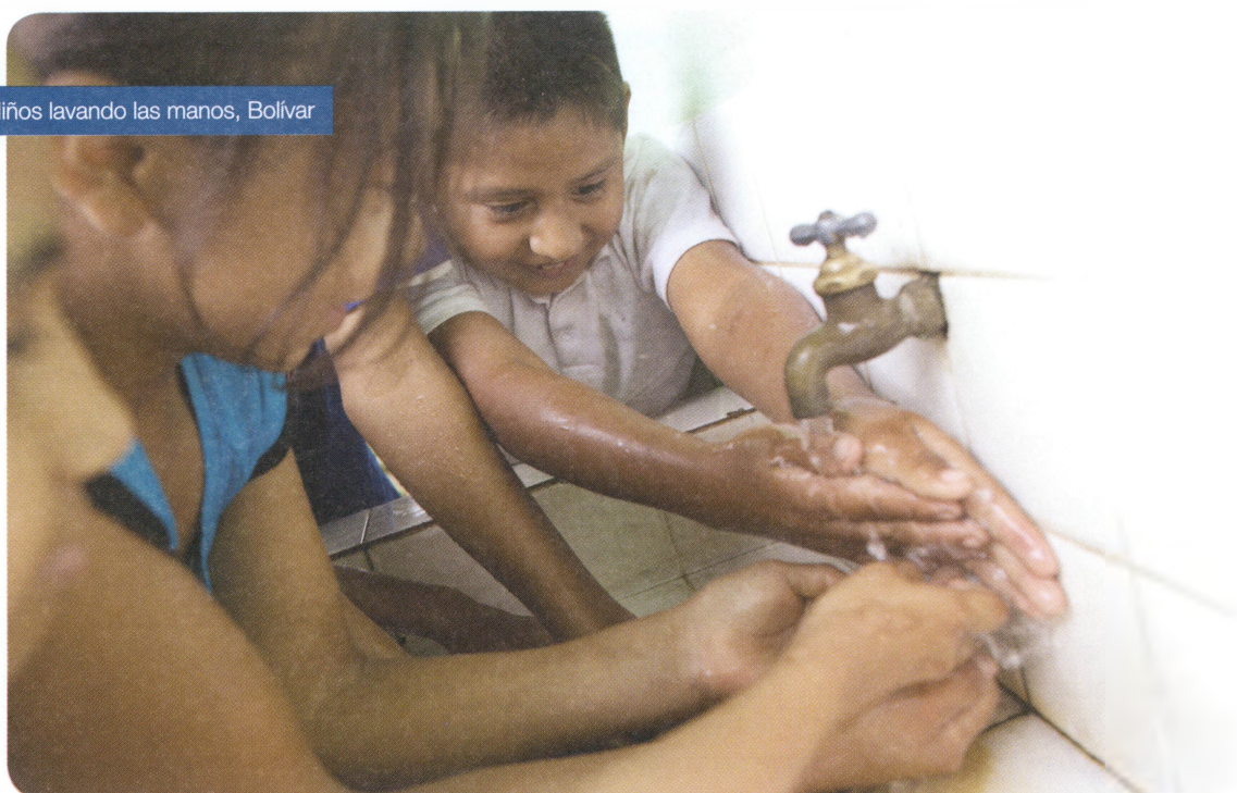
Niños lavando las manos, Bolívar

Todos los aspectos señalados anteriormente deben estructurarse bajo el criterio de plan de negocios 18 . Concretamente los aspectos centrales que deberán desarrollarse para viabilizar la legalización de una estructura mancomunada para prestación de servicios de agua y saneamiento, son los siguientes: