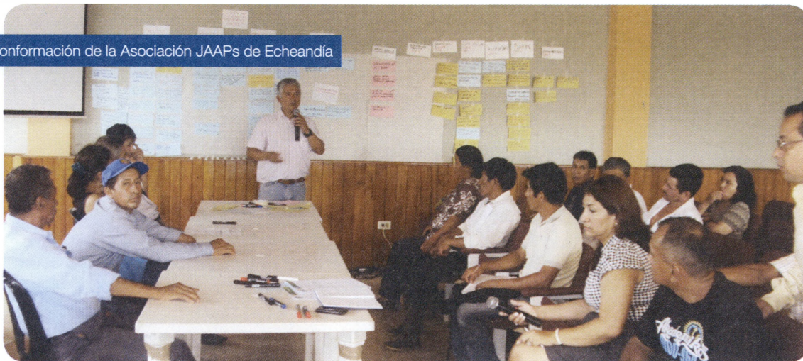
Conformación de la Asociación JAAPs de Echeandía

En cuanto al uso del agua, la normativa legal competente sigue vinculada a la Ley de Aguas, en donde se establece que los recursos hídricos son bienes de uso público y, en tal medida, se regulan los procedimientos para la concesión de aguas y los usos de ríos y afluentes. Respecto a la contaminación que pueden sufrir estos recursos, la Ley prohíbe la contaminación del agua y reenvía su control a las autoridades competentes en materia ambiental.