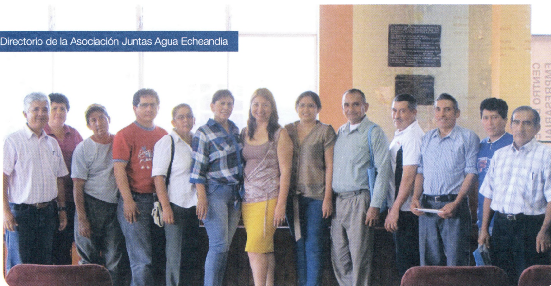
Directorio de la Asociación Juntas Agua Echeandia