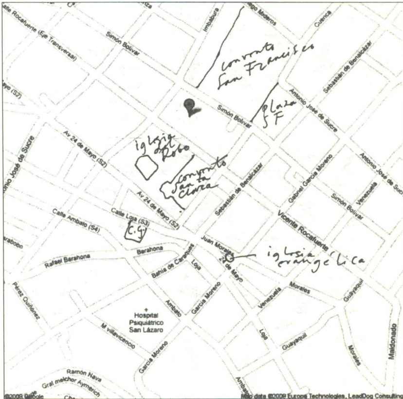
Plano 1 Ubicación CGSR