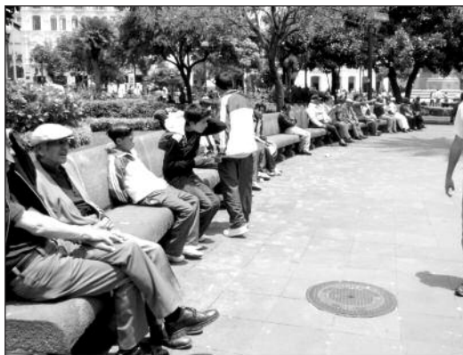
Fotografía 1 Silla de hormigón. Disposición en hilera (Plaza Grande)

Las sillas de la plaza acogen a casi trescientas personas. Existen cuatro estancias para veintiún personas, además de caminerías iluminadas dotadas de basureros y protegidas de la circulación vehicular con mojones. Las sillas tienen dimensiones ergonómicamente adecuadas en medidas para adultos, aunque están hechas con materiales duros. Están medianamente protegidas del sol y podría decirse que prestan una confortabilidad mediana a sus ocupantes. Es necesario hacer notar que las condiciones de mobiliario se estudian desde la ergonomía para medir/controlar los tiempos de estancia según los requerimientos de los distintos ambientes arquitectónicos. Las sillas se disponen generalmente en hilera, respetando y/o propiciando el individualismo de sus ocupantes. Las cuatro estancias que posibilitan la comunicación grupal casi se desintegran por presencia de una pila central, volviendo entonces a la hilera.