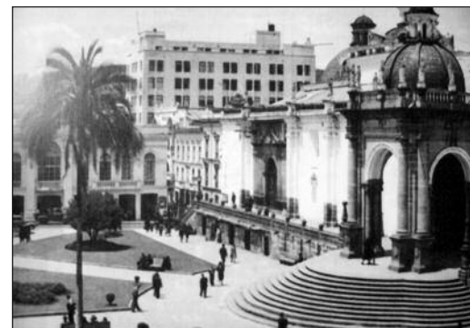
Fotografía 6 Imagen de la Plaza Grande