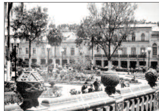
Fotografía 7 Imagen de la Plaza Grande 1952