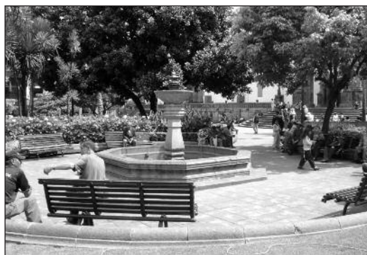
Fotografía 8 Imagen de la Plaza Grande 2010