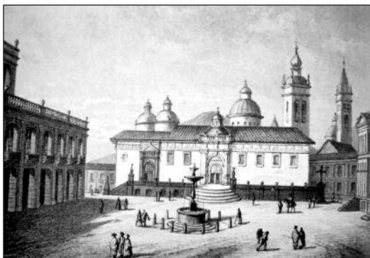
Fotografías 5 Imagen de la Plaza Grande 1853

El ajardinamiento de la plaza –realizado por García Moreno– se mantiene y se cuida. La razón quizá sea que cumple funciones más importantes que las puramente simbióticas, pues, además de la forma, la fragilidad de sus componentes delimitan con facilidad la formación de protestas.