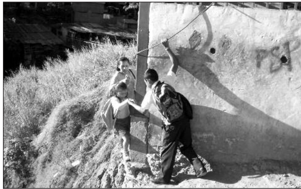
Fotografía 2 Paso peatonal cotidiano en Barrio Nuevo (período octubre 2008-abril 2009)