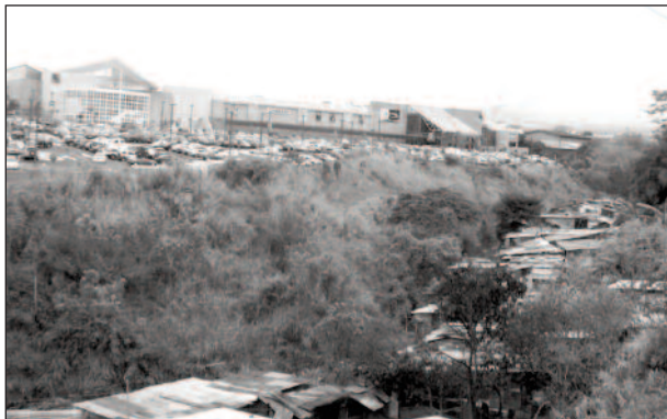
Fotografía 1 Centro comercial Multiplaza y Barrio Nuevo separados por el Río María Aguilar, Curridabat, San José

Fuente: fotografía propia (21 de setiembre de 2010).