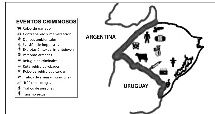
Mapa N.º 1 Mapa dos Eventos Criminosos Realizados à Zona de Fronteira Segundo UF (Brasil - 2008)