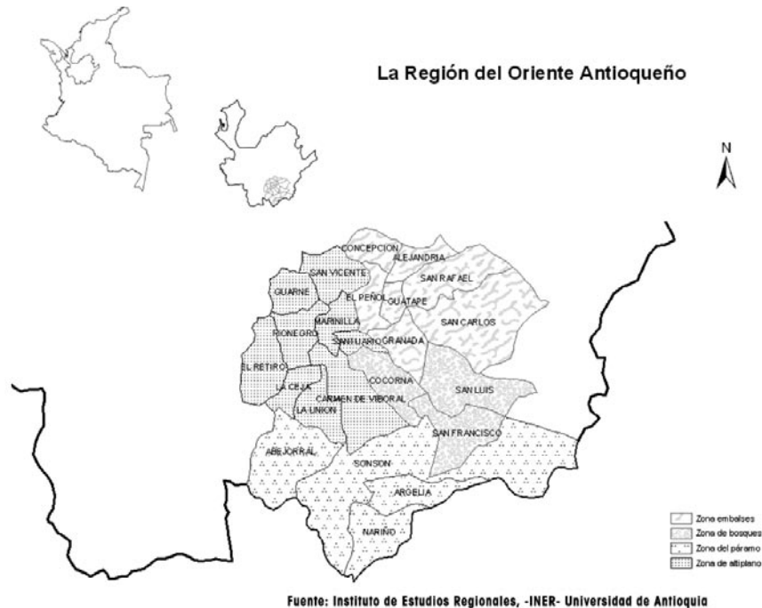
Figura 17. Mapa del Oriente Antioqueño

A partir de la década de 1970 se adelanta la construcción de grandes obras de infraestructura: aeropuerto de Rionegro, centrales hidroeléctricas y la autopista Medellín-Bogotá, con importantes repercusiones en el acontecer regional y local.