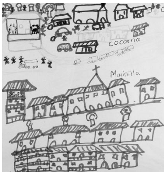
Figura 20. Cocorná