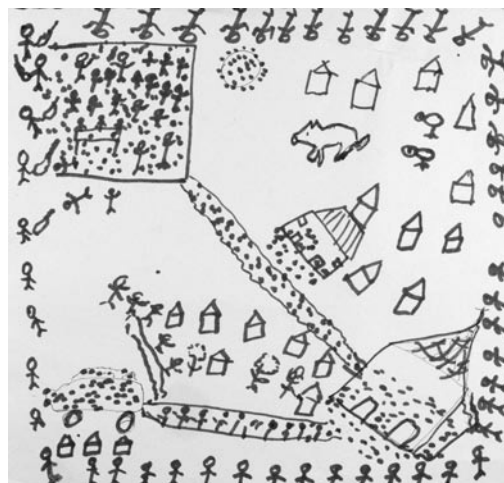
Figura 21. Imagen masacre de El Prodigio (San Luis)