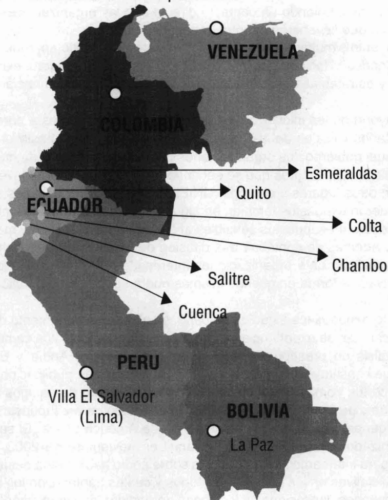
Figura 1: Localización de las experiencias