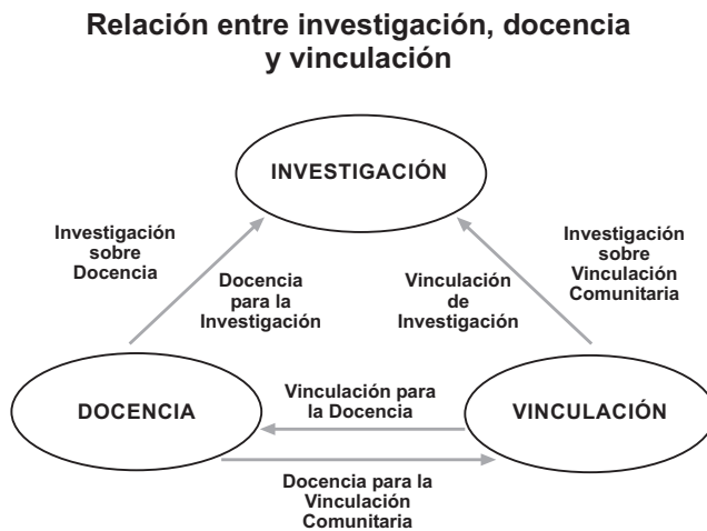
Gráfica n° 1: Investigación, docencia y vinculación en la UVI

“institutos de investigación”, mediante la nueva figura de los “departamentos”, la UVI está procurando anticiparse a dichas transformaciones, a menudo muy lentas. Por ello, las orientaciones que ofrece la licenciatura en Gestión Intercultural para el Desarrollo se están transformando en los futuros Departamentos de “Comunicación”, “Sustentabilidad”, “Lenguas”, “Derechos” y “Salud”. Cada Departamento estará conformado por los profesores responsables de la respectiva orientación en cada una de las cuatro sedes regionales y de la sede de Xalapa, constituyéndose en incipientes “Cuerpos Académicos” que combinan tareas de docencia, investigación y vinculación comunitaria a raíz de las llamadas “Líneas de Generación y Aplicación de Conocimiento”. Así, las actividades de investigación vinculada de los profesores se articulan estrechamente con las demandas de las comunidades y las prácticas de gestión e intervención de los alumnos. El resultado es un concepto integral y circular de docencia/investigación/vinculación, que se sintetiza en la gráfica n° 1.