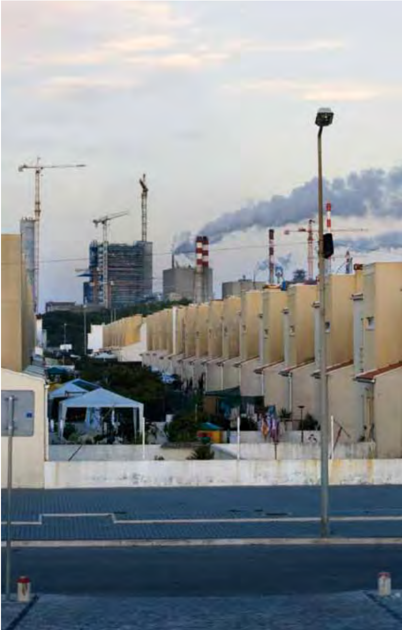
Autoría: Mercedes Espáñez, País: Estado Español