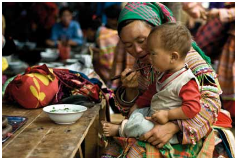
Autoría: Mercedes Álvarez Espáñiz. País: Vietnam

La forma en que se diseñen e implementen las políticas públicas y las normativas dirigidas a la empresa privada (a la que habrá que obligar a hacerse responsable de la vida humana), cómo se configuren los sistemas de protección social, estarán configurando una organización específica de distribución del tiempo y del espacio, de utilización de los recursos públicos y privados.