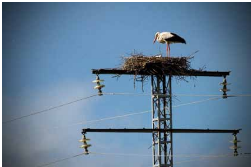
Autor/a: Dudua. País: Estado Español