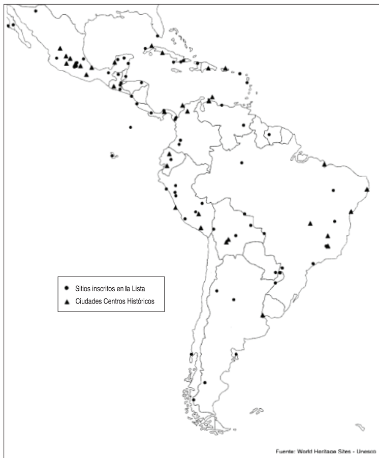
GRÁFICO 3 Ubicación de los sitios del Patrimonio Mundial en América Latina y El Caribe

ticas, que intentan imponer, encasillar o vender modelos externos a cada una de las realidades como forma de replicar o reproducir los llamados casos exitosos. 149